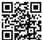
GS1 QR Code