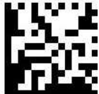
GS1 Data Matrix