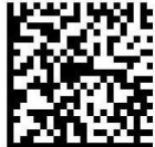
GS1 Digital Link